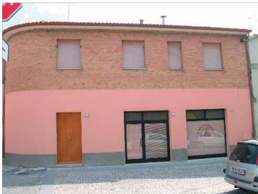
Via de Amicis 10; 12 Fronte Principale